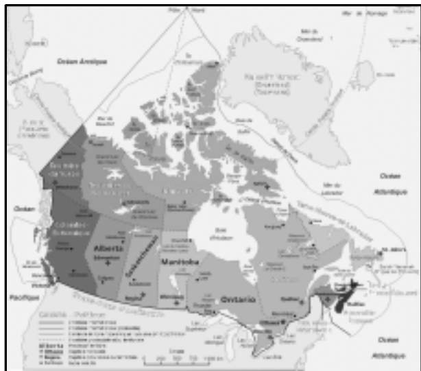
La province de Québec dans le Canada

L'histoire du Québec à l'intérieur du Canada est unique non seulement du point de vue de la particularité de sa langue et de sa culture, mais aussi au niveau des diverses institutions qui se sont développées au fil du temps. L'école et la formation de ses enseignants sont de celles qui ont connu une évolution importante, car elles ont toujours été intimement liées de près aux divers mouvements de changement. La formation des maîtres du Québec est décrite ici par le biais de son histoire et en référence à l'évolution de son système éducatif qui lui ont donné sa spécificité.